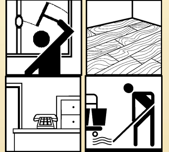
Çok Amaçlı Genel Temizlik